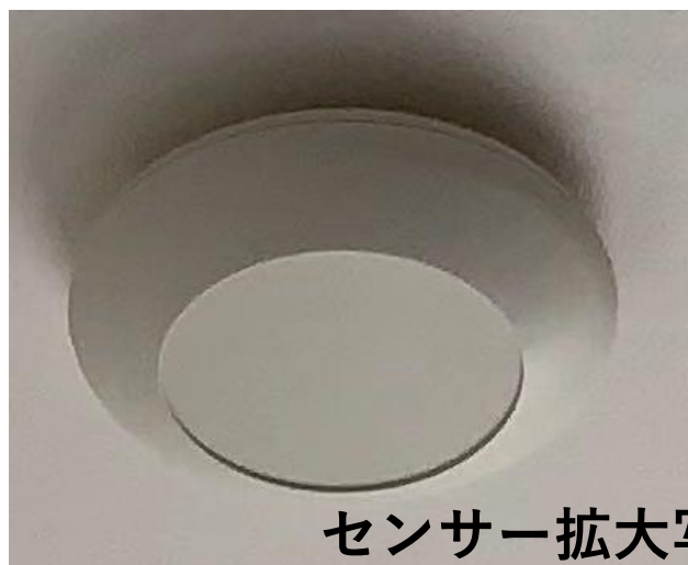
センサー拡大写真

ベッド上に設置したバイタルセンサーが、入居者様の呼吸・体動を随時読み取り、呼吸異常や夜間長期離床などの緊急事態をスタッフに通報します。